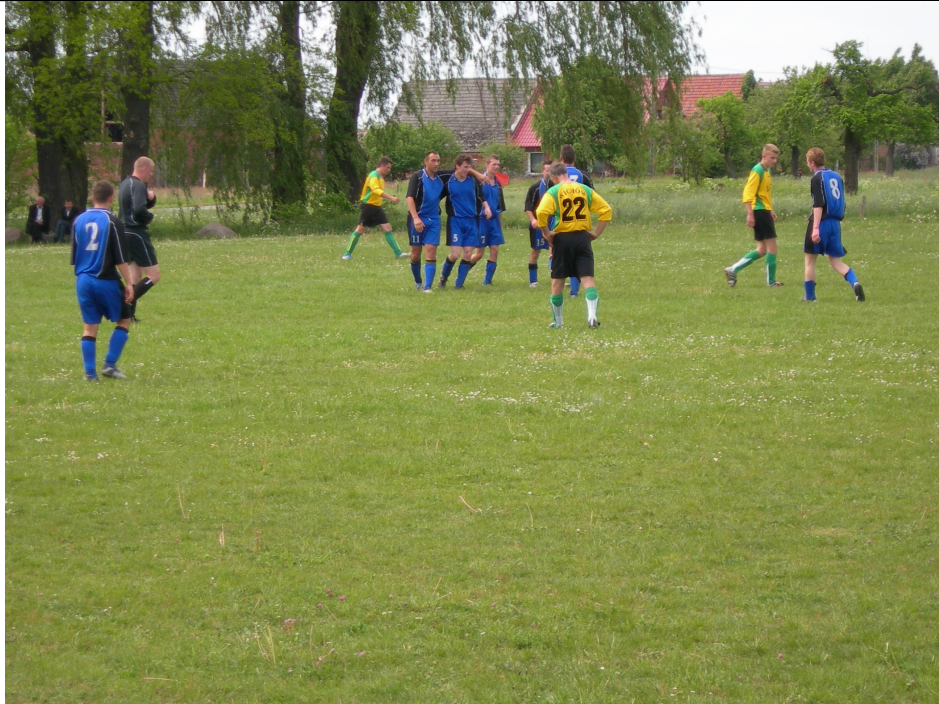
Rok 1994; zdobycie Pucharu Wójta przez "Kwisę" Trzebów