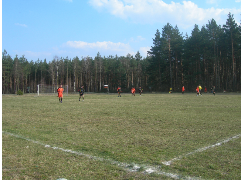
Rok 2004 ; mecz z Pożarowem w Rudawscy