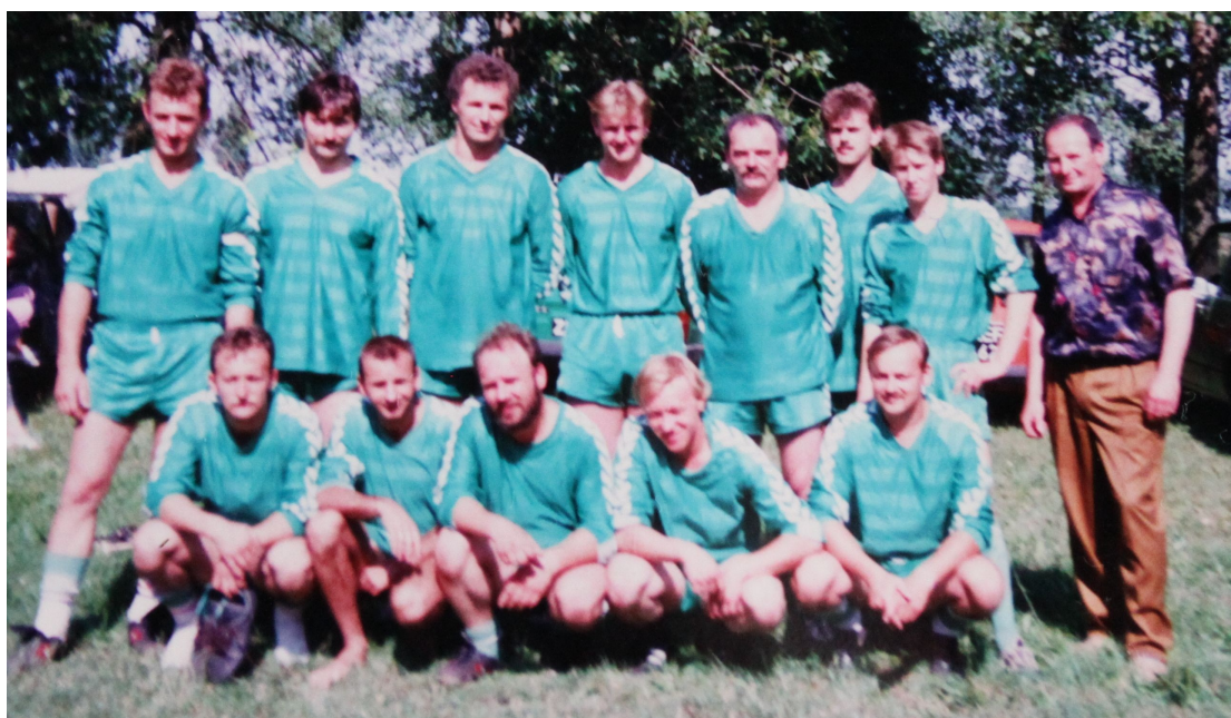
Rok 1994; zdobycie Pucharu Wójta przez "Kwisę" Trzebów – drużyna pucharowa