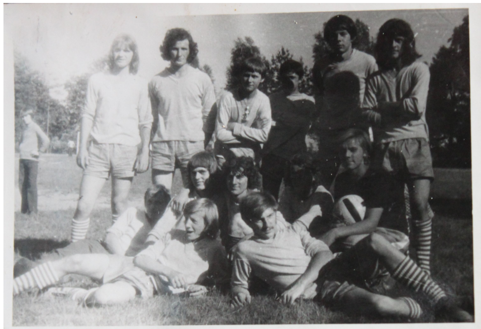
Rok 1974 ; drużyna zgłoszona do regularnych rozgrywek w kl.C

W 2012r. zostało wybudowane zaplecze sportowe do boiska.