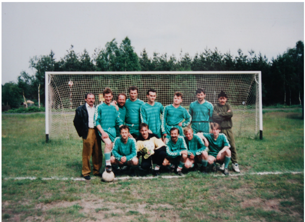
Lata 90te ; na boisku w Rudawicy