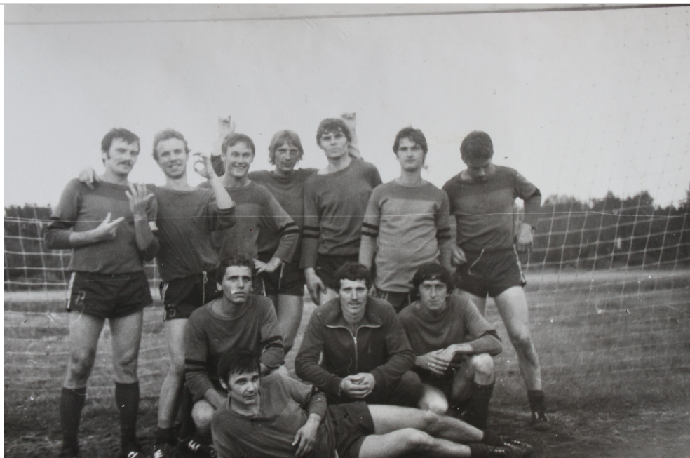
Rok 1981 mecz "Kwisa" Trzebów vs. Wymiarki