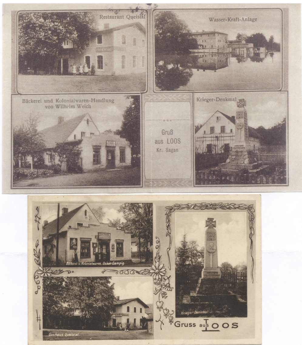
Wieś Łoza na dawnych kartkach pocztowych

książęca. W 1845 roku było w Łozach 76 domów i 471 mieszkańców. Na mapie z końca XIX wieku zaznaczony został tartak wodny.