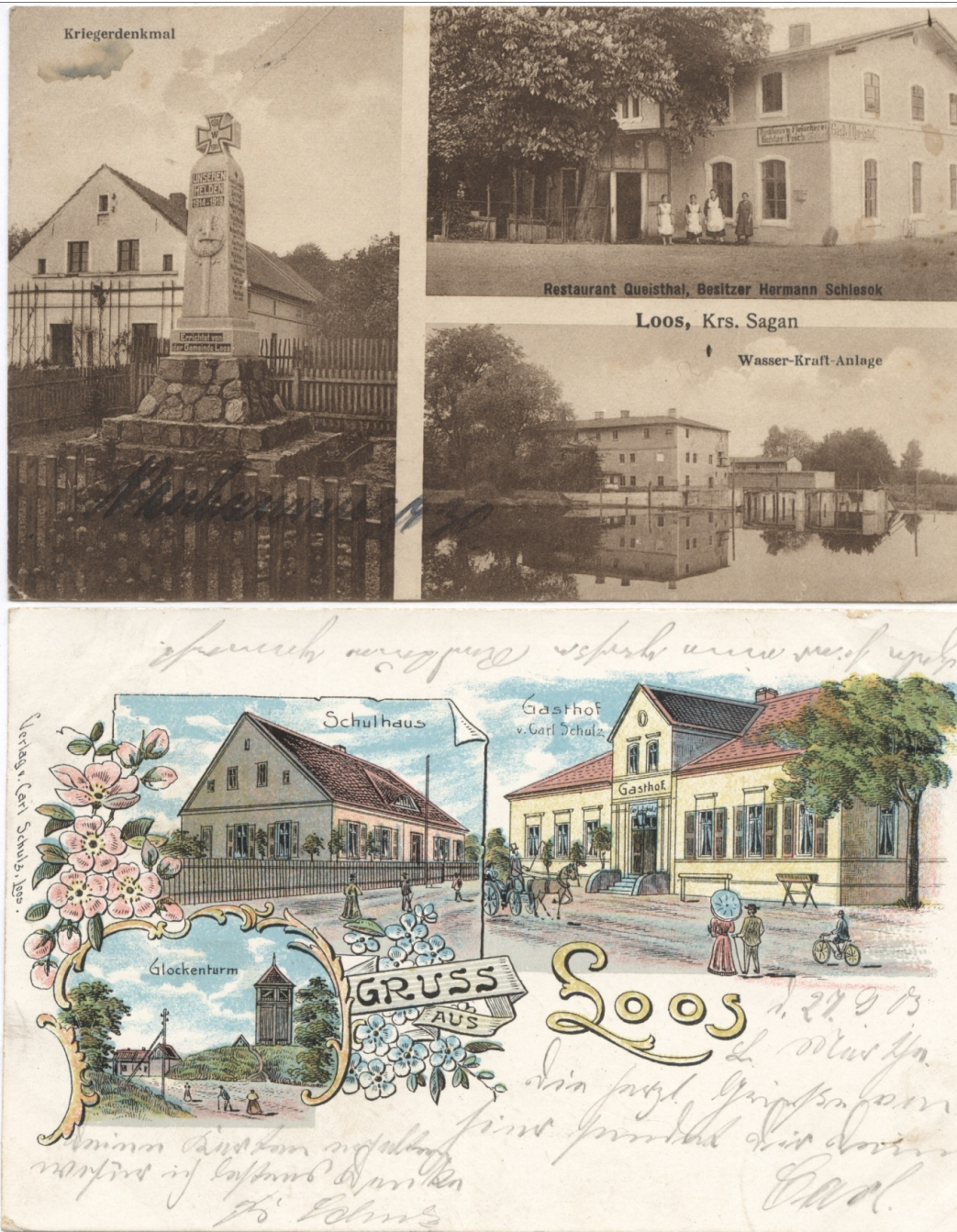
Wieś Łoźy na dawnych kartkach pocztowych