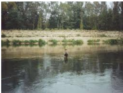
Rzeka Kwisa w zasięgu wsi Łozy