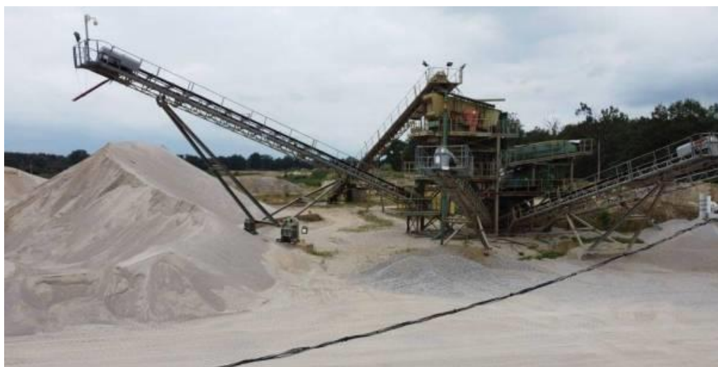
Widok na zakład przeróbczy