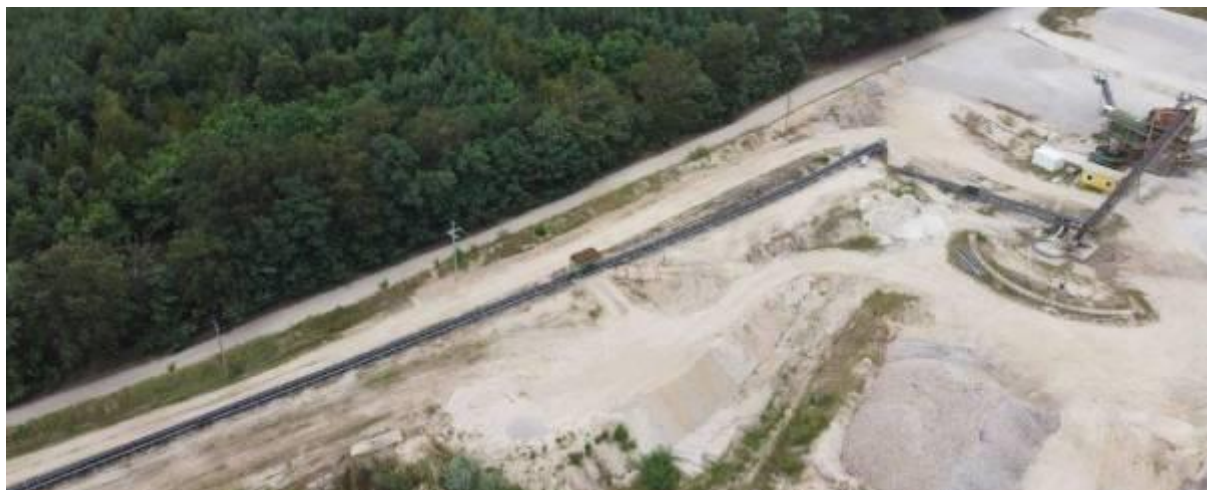
Widok taśmociągu i zakładu przeróbczego