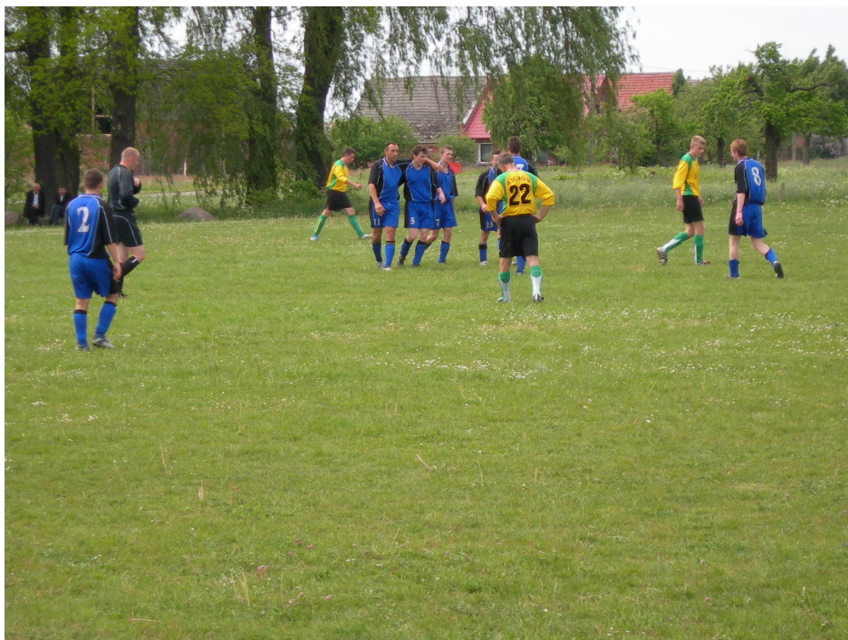
Rok 1994; zdobycie Pucharu Wójta przez "Kwisę" Trzebów