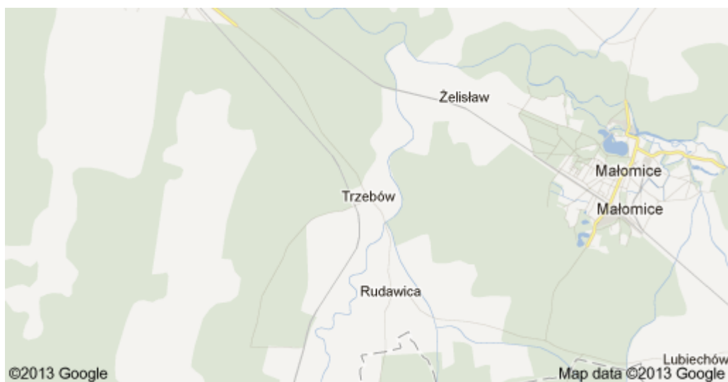
Usytuowanie wsi Trzebów na mapie