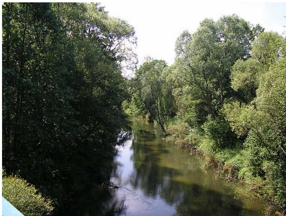
Rzeka Kwisa na wysokości wsi Trzebów