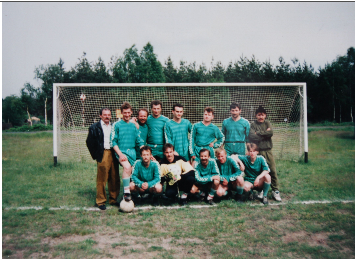
Lata 90te ; na boisku w Rudawicy