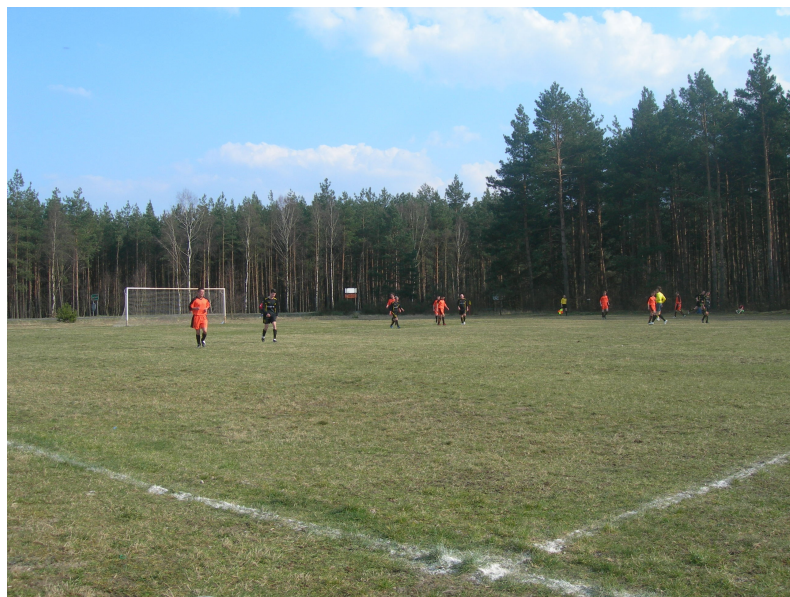
Rok 2004 ; mecz z Pożarowem w Rudawscy