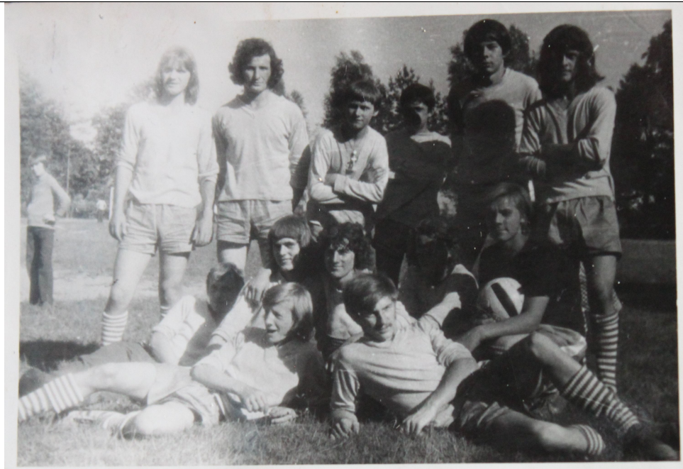
Rok 1974 ; drużyna zgłoszona do regularnych rozgrywek w kl.C